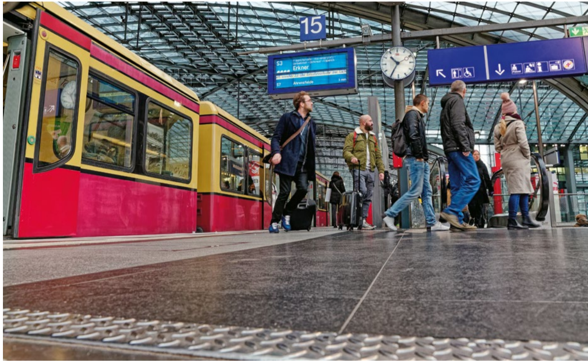
Ob die Fahrgäste das D-Ticket auch 2025 zum Preis von 49 Euro erwerben können, ist unklar.

Palmer kritisiert mit einem Verweis auf einfache Lösungen in Frankreich, dass Deutschland immer am kompliziertesten dabei sei, bestimmte Vorgaben zu erfüllen. Man brauche hierzulande für alles „500 Seiten Gutachten und Ausführungsbestimmungen“. Palmer erwartet daher, dass keine Kommune in Baden-Württemberg bei einem solchen Modell mitmachen werde. (FM)