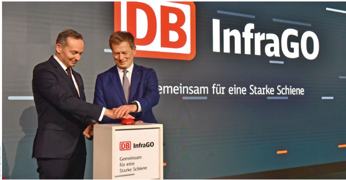
Bundesverkehrsminister Volker Wissing und DB-Vorstandschef Richard Lutz starteten symbolisch das neue Unternehmen.